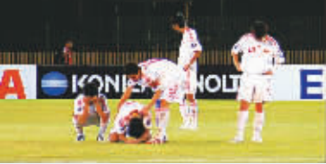
中国队无缘亚青赛四强后，队员失望不已。

中国飞人刘翔这个冬天也很难过，他正在为是否做手术而苦恼。其实，对于刘翔他首先要考虑的是自身长期健康，能否比赛则在其次。因为，不管他是否承认，属于他的时代已经基本过去了。这也许让人难以接受，但是，除了古巴小将罗伯斯的成长之外，最主要是刘翔的年纪，手术之后复出，刘翔该27岁了。这个年纪对于短距离项目来讲有些大了。