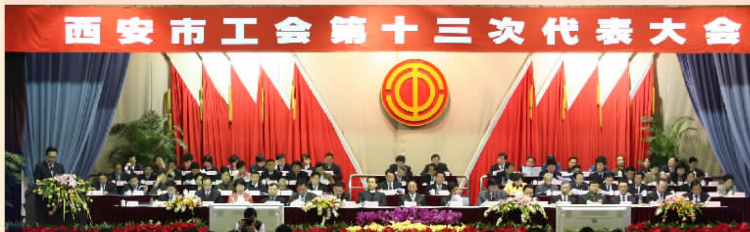
西安市工会第十三次代表大会会场。