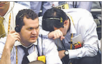
巴西圣保罗证券交易所交易员