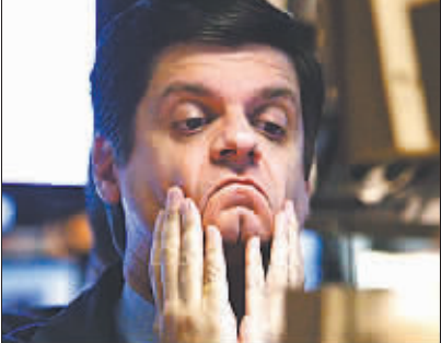
美国纽约证券交易所交易员