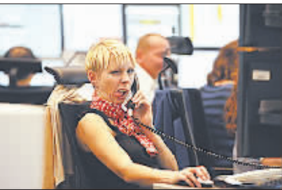
德国法兰克福证券交易所交易员