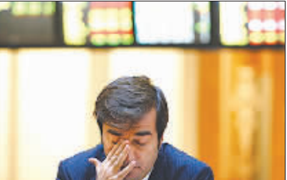
西班牙马德里证券交易所交易员