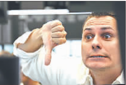
德国法兰克福证券交易所交易员