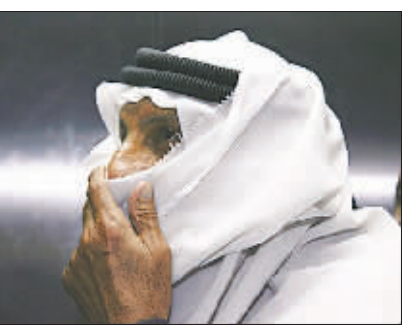
约旦安曼证券交易所交易员