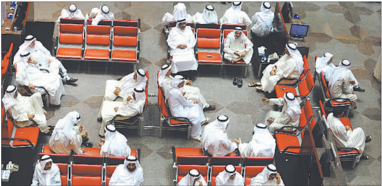
▲10 月 7 日，在科威特股票交易所，股民在关注股票行情。受全球金融危机影响，中东地区各国股市当日纷纷下跌。当天跌幅最大的是埃及股市，其股指下跌了 16.4%，这是两年里埃及股市最大一次跌幅。

严重金融危机冲击，当前主要发达经济体的经济状况“已经或接近于衰退”。报告预测，今明两年发达经济体的经济增速分别为 1.5%和 0.5%，远低于去年的 2.6%。其中，此次金融危机的发源地——美国今年的经济增长预计为 1.6%，明年则只有 0.1%。意大利经济今明两年都将为负增长，德国经济明年的增长率