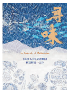
《寻味》林辉辉 著 广西师范大学出版社