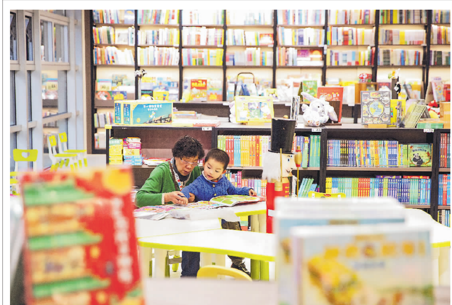
中关村图书大厦重新开业

近日,历经百日闭店精心装修的中关村图书大厦重新开业。中关村图书大厦有着20余年历史,坐落于高校林立的北京市海淀区,被誉为“百万学子大书房”。重装后的中关村图书大厦汇集15万余种图书品种,图书选品结合海淀区科技、人文、教育特质,并改变传统图书陈列方式,营造“科技创新、人文素养、终身学习”三大主题楼层。这里不再只是购书的场所,更是将阅读与生活美学、科创赋能、休闲娱乐等功能融为一体的沉浸式文化空间。