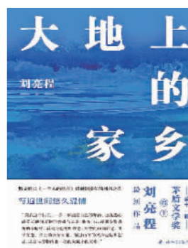
《大地上的家乡》刘亮程 著 译林出版社