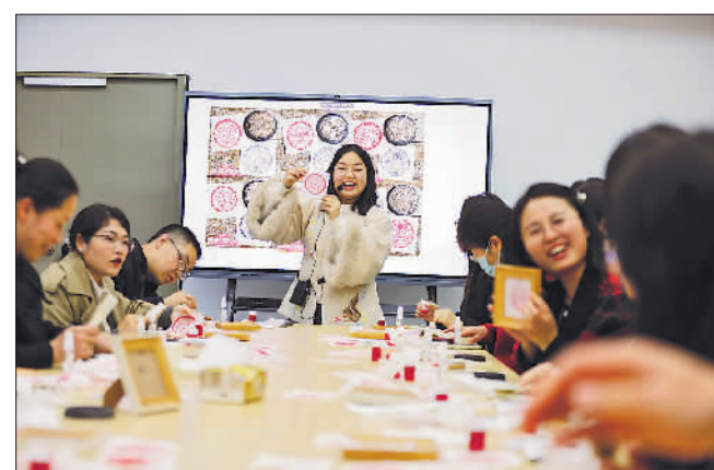
3月28日晚,南京江北新区绿水湾社区非遗拓印课程。