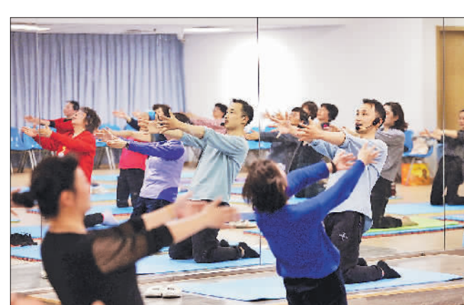
4月1日晚,南京市文化馆的形体课程。