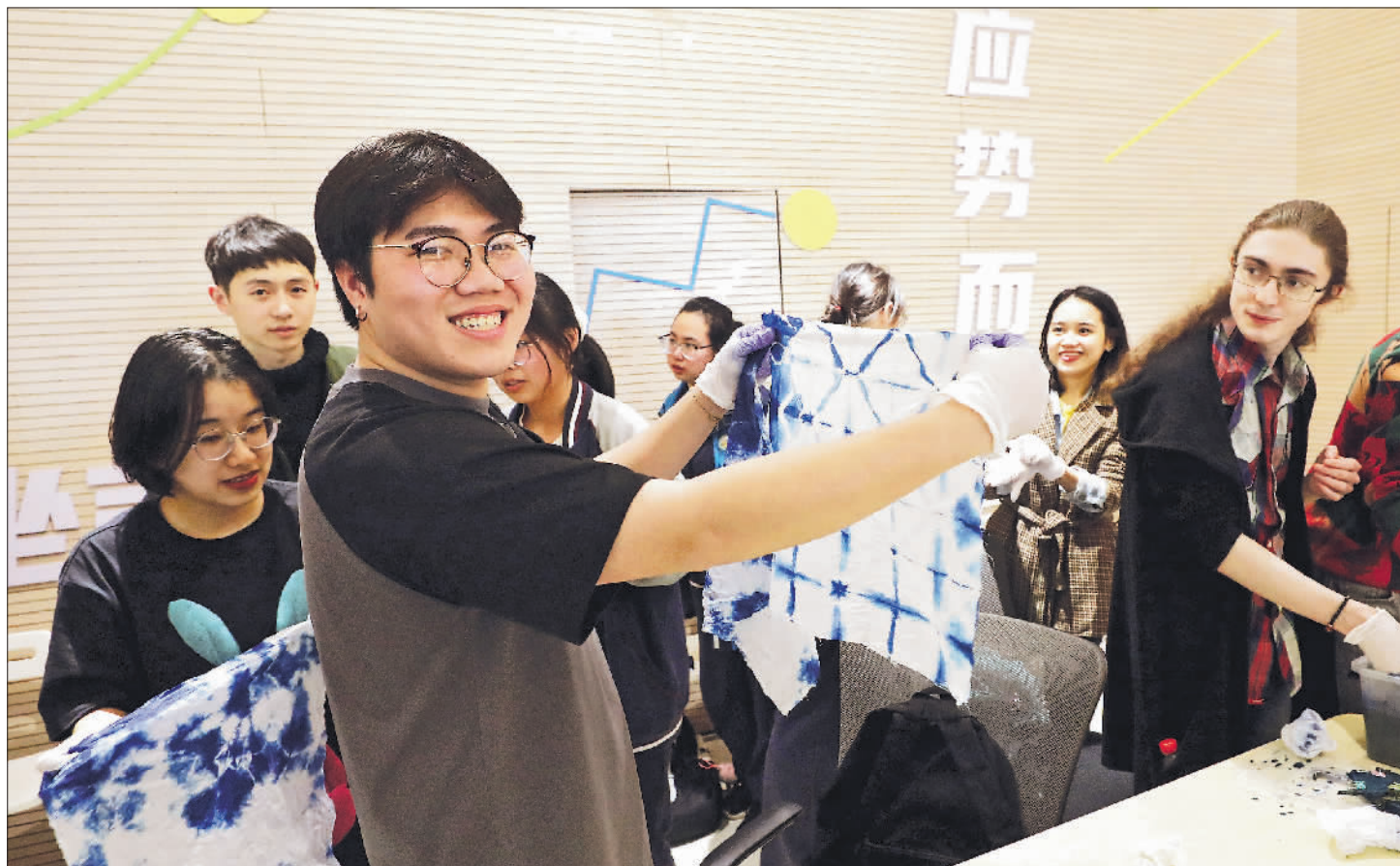
3月29日晚,在南京市鼓楼区的一堂扎染课上,一位来自越南的南京大学留学生展示自己的扎染作品。