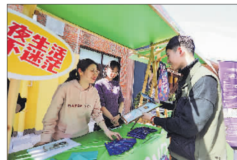
3月29日,南京101名潮里园区集市,“鼓楼青年夜校”的宣传摊位。