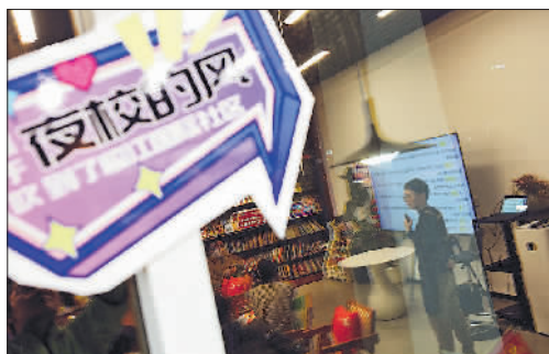
3月28日晚,南京江北新区临江社区青年夜校咖啡品鉴课程。