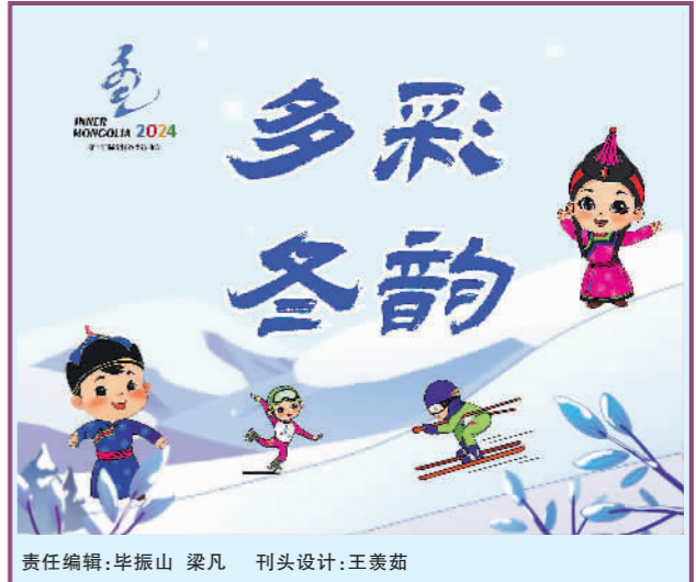
责任编辑:毕振山 梁凡 刊头设计:王美茹