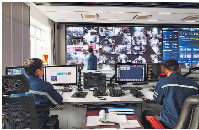
2月4日,在范矿智能化调度指挥中心,工作人员正在监控井下生产情况。