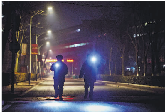
2月7日,护矿队员在范矿矿区进行夜间巡视。