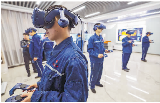
2月8日,在范矿VR模拟训练室,工人们正在进行井下采掘设备作业训练。

2月4日至12日,《工人日报》记者到范矿生产一线蹲点,记录下春节保供期间“新中国第一矿”的独特年味。