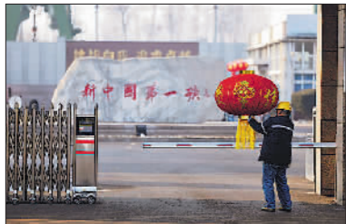
2月7日,工人在范矿大门口悬挂大红灯笼。