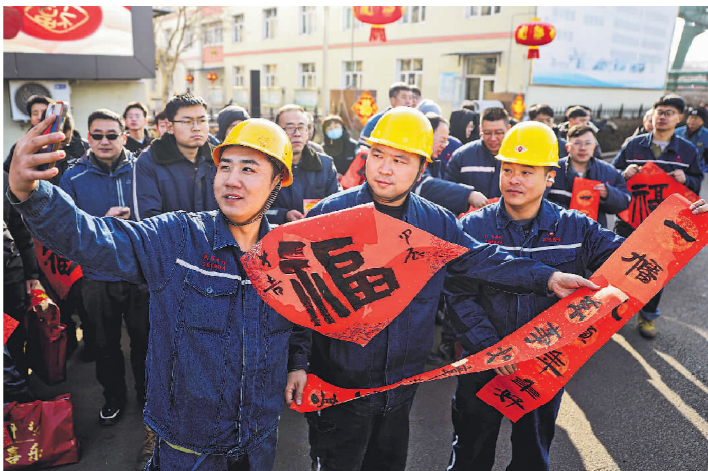
2月7日,在范矿宿舍楼前,工人们收到开滦书画家现场书写的春联和福字后合影留念。