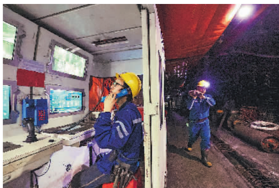
2月7日,在范矿井下,集控仓内的工人(图左)手持电话与地面调度指挥中心进行沟通。