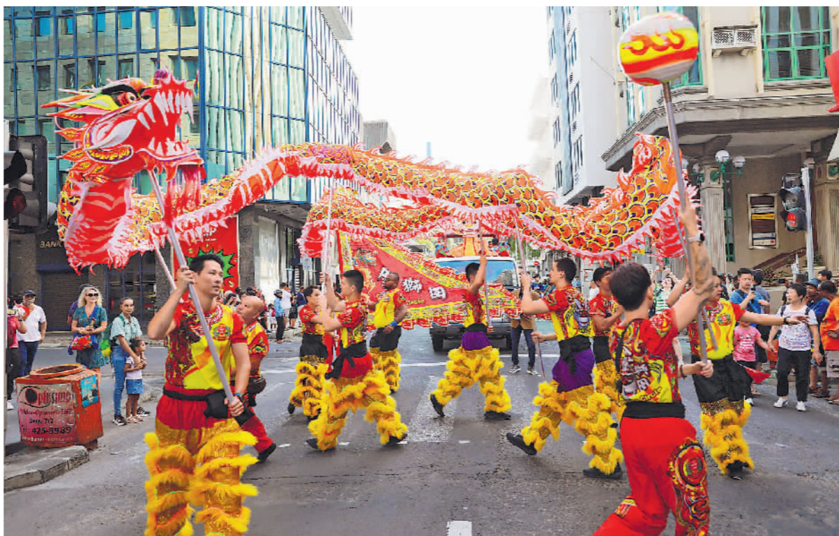
▲当地时间2月3日,在毛里求斯首都路易港,参加2024“欢乐春节”花车巡游活动的演员进行舞龙表演。