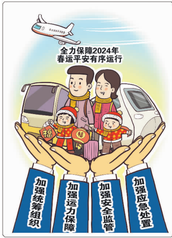
新华社发 朱慧卿 作