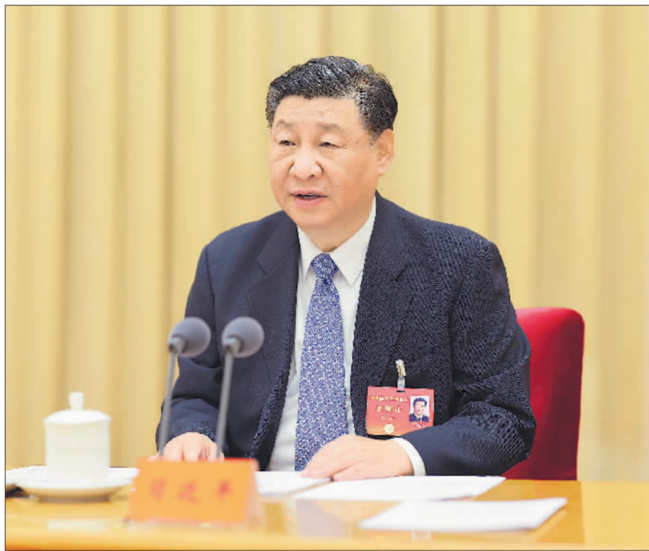
12月11日至12日，中央经济工作会议在北京举行。中共中央总书记、国家主席、中央军委主席习近平出席会议并发表重要讲话。

■做好明年经济工作，要以习近平新时代中国特色社会主义思想为指导，全面贯彻党的二十大精神，坚持稳中求进工作总基调，完整、准确、全面贯彻新发展理念，加快构建新发展格局，着力推动高质量发展，全面深化改革开放，推动高水平科技自立自强，加大宏观调控力度，统筹扩大内需和深化供给侧结构性改革，统筹新型城镇化和乡村全面振兴，统筹高质量发展和高水平安全，切实增强经济活力、防范化解风险、改善社会预期，巩固和增强经济回升向好态势，持续推动经济实现质的有效提升和量的合理增长，增进民生福祉，保持社会稳定，以中国式现代化全面推进强国建设、民族复兴伟业。