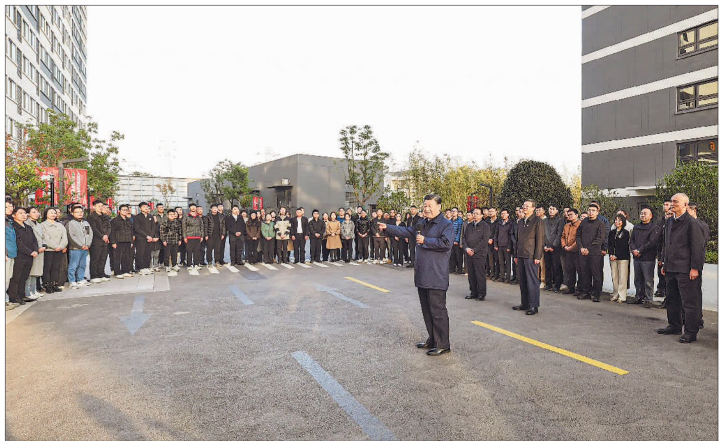
11月28日至12月2日，中共中央总书记、国家主席、中央军委主席习近平在上海考察。这是11月29日下午，习近平在闵行区新时代城市建设者管理者之家，同社区居民亲切交流。

新华社上海/江苏盐城12月3日电 中共中央总书记、国家主席、中央军委主席习近平近日在上海考察时强调，上海要完整、准确、全面贯彻新发展理念，围绕推动高质量发展、构建新发展格局，聚焦建设国际经济中心、金融中心、贸易中心、航运中心、科技创新中心的重要使命，以科技创新为引领，以改革开放为动力，以国家重大战略为牵引，以城市治理现代化为保障，勇于开拓、积极作为，加快建成具有世界影响力的社会主义现代化国际大都市，在推进中国式现代化中充分发挥龙头带动和示范引领作用。 ■上海要完整、准确、全面贯彻新发展理念，围绕推动高质量发展、构建新发展格局，聚焦建设国际经济中心、金融中心、贸易中心、航运中心、科技创新中心的重要使命，以科技创新为引领，以改革开放为动力，以国家重大战略为牵引，以城市治理现代化为保障，勇于开拓、积极作为，加快建成具有世界影响力的社会主义现代化国际大都市，在推进中国式现代化中充分发挥龙头带动和示范引领作用。 ■城市不仅要有高度，更要有温度。我们的社会主义就是要走共同富裕的路子。外来务工人员来上海作贡献，同样是城市的主人。要践行人民城市理念，不断满足人民群众对住房的多样化、多元化需求，确保外来人口进得来、留得住、住得安、能成业。 ■坚持党的领导是中国式现代化的本质要求，也是根本保证。上海是我们党的诞生地，要用好一大会议址等红色资源，弘扬伟大建党精神，教育引导广大党员、干部牢记“三个务必”，在新征程上开拓创新、奋发进取、真抓实干。