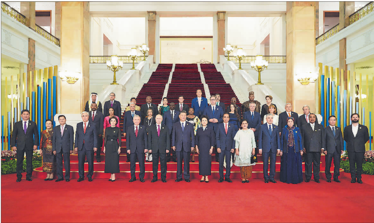
10月17日晚，国家主席习近平和夫人彭丽媛在北京人民大会堂举行宴会，欢迎来华出席第三届“一带一路”国际合作高峰论坛的国际贵宾。这是习近平发表祝酒辞，代表中国政府和中国人民对各位嘉宾出席第三届“一带一路”国际合作高峰论坛表示热烈欢迎。