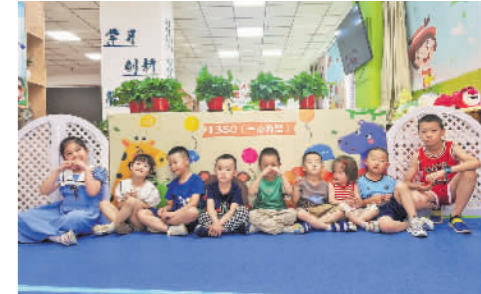
国网张掖供电公司职工子女托管班。

服务身心健康，满足职工对美好生活的向往。启动首届员工健康节，深入推进“读一本好书，参加一项体育活动，培养一项文艺爱好，参与一次心理健康咨询，参加一次健康体检测试，建立一份健康档案”的“六个一”专项行动。建成职工体检检测中心3个，助力职工身体健康和企业安全生产。搭建“高校+工会”模式职工心理关爱工程(EAP)，测试4000余名职工心理健康状态，举办心理健康大讲堂15次，送健康医疗服务活动5场，接听咨询热线103起。建成母婴休息室20座、职工子女托管班6座。女职工特殊重大疾病补助资金累计救助61人。“守望相助”“幸福港湾”“幸福建家”“幸福牵手”活动，体现了公司党委对职工细致入微的关心关爱，真正做到了以小见大、见微知著。