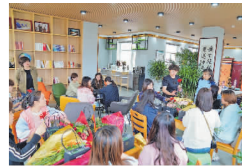
国网武威供电公司职工在高原氧吧茶艺制作。

程现场42处；组织文艺小分队赴一线班组演出，送出文艺演出50余场，赠送书法美术摄影作品1万余幅，流动书箱80个、图书2000余册。开展“健康家园”系列文艺活动120多项，举办“祖国有我”庆祝华诞职工文化成果展演，网络直播点击率达10万人次以上。参加甘肃省运动会、甘肃省职工运动会，职工参与率达87%。举办摄影讲座、书画交流活动，开展文学、摄影采风活动，编印了《光明颂》等11本职工文学丛书，营造了浓厚的文学创作氛围。