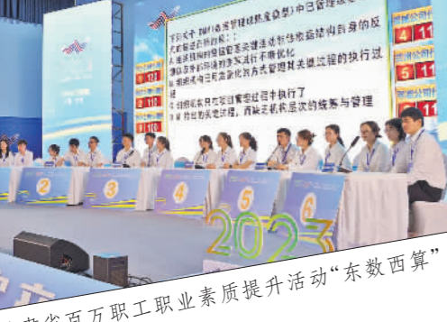
甘肃省百万职工职业技能提升活动“东数西算”数字产业技能大赛。