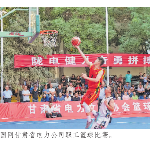
国网甘肃省电力公司职工篮球比赛。