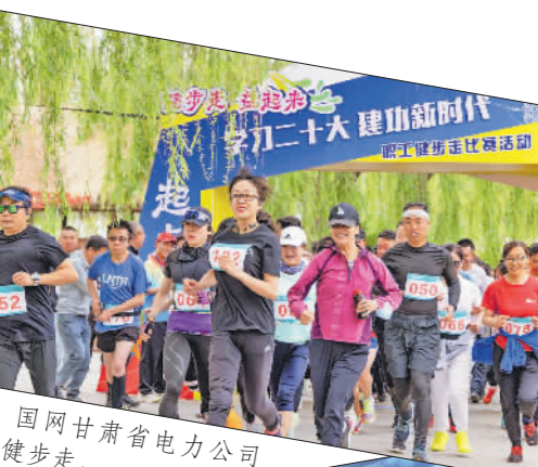
国网甘肃省电力公司职工健步走。

“文化三进”，丰富职工精神文化生活。开展文化进藏区基层单位、进定点帮扶村、进红色纪念地一线班组和“警企合作送温暖”“文化传承”“文化送福”“文化下基层”等活动，累计慰问基层站所140余个、一线班组8个，重点工