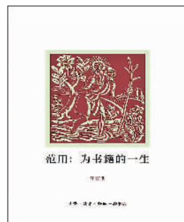
《范用》 汪家明著 生活·读书·新知三联书店