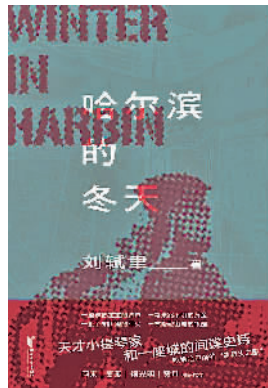
《哈尔滨的冬天》 刘钺著 浙江文艺出版社