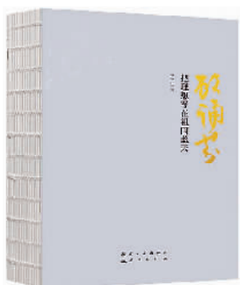
《顾诵芬:把理想写在祖国蓝天》 罗元生著 华文出版社

20世纪30年代初,远东局势突变,共产国际的情报工作屡屡受挫,一枚包含绝密信息的银圆意外落入伪满情报机关手中。天才小提琴家、顶级特工高钰珩受到委派,从莫斯科回到熟悉的家乡哈尔滨开展潜伏工作。以数学家生命为代价的密电之战,对日本新战机的爆破、与顶头上司的隔空斗法……冰与火的考验中,高钰珩逐渐成长为真正的战士。