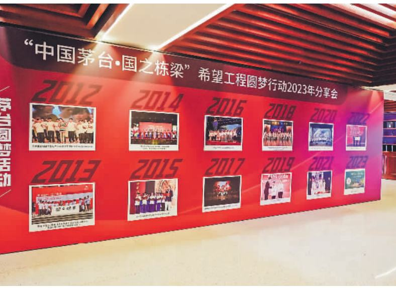
“中国茅台·国之栋梁”希望工程圆梦行动和2023年大型公益助学活动顺利启动。