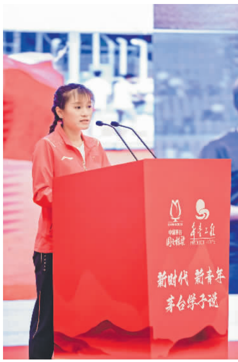
获助学生代表发表感言。