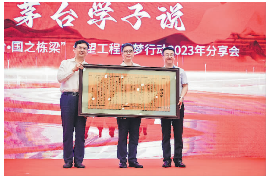
中国青少年发展基金会向茅台集团致送《栋梁赋》牌匾。