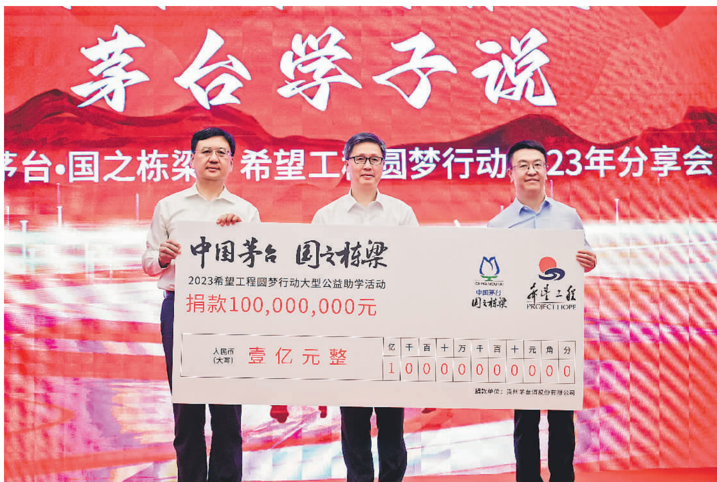
贵州茅台再次向希望工程捐资1亿元。

时隔11年，“中国茅台·国之栋梁”再次回到北京，重返梦想开始的地方，不仅将延续新时代国家慈善攻坚、助学育人品牌的标志性、引领性项目，继续不忘初心持之以恒播种新希望，助力国之栋梁茁壮成长，还要向善而行，当好社会责任的领头雁和带头人，在推进中国式现代化建设和实现共同富裕进程中展现更大茅台担当。