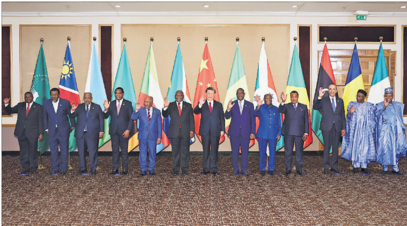
当地时间8月24日晚,国家主席习近平和南非总统拉马福萨在约翰内斯堡共同主持中非领导人对话会。非盟轮值主席、科摩罗总统阿扎利,中非合作论坛非方共同主席国、塞内加尔总统萨勒,非洲次区域组织代表赞比亚总统希奇莱马、布隆迪总统恩达伊施米耶、吉布提总统盖莱、刚果(布)总统萨苏、纳米比亚总统根哥布、乍得总理凯布扎博、利比亚总统委员会副主席库尼、尼日利亚副总统谢蒂马,以及非盟委员会代表穆昌加等出席。这是会前集体合影。