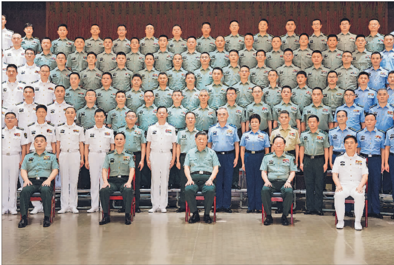
7月6日，中共中央总书记、国家主席、中央军委主席习近平视察东部战区机关，代表党中央和中央军委，向东部战区全体官兵致以诚挚问候。这是习近平亲切接见东部战区官兵代表，同大家合影留念。

习近平强调，当前，世界进入新的动荡变革期，我国安全形势不确定性增大。要时刻保持忧患意识，坚持问题导向，增强忧患意识，全力以赴履行好战区主战职能。要深化战争和作战筹划，建强战区联合作战指挥体系，大抓实战化军事训练，加快提高打赢能力。要坚持从政治高度思考和处理军事问题，敢于斗争、善于斗争，坚决捍卫国家主权、安全、发展利益。要全面加强党的建设，抓好学习贯彻新时代中国特色社会主义思想主题教育和“学习强军思想、建功强军事业”教育实践活动，持之以恒正风肃纪反腐，扎实做好抓基层打基础工作，提高战区党委领导备战打仗能力，把党和人民赋予的各项任务完成好。张又侠等参加活动。