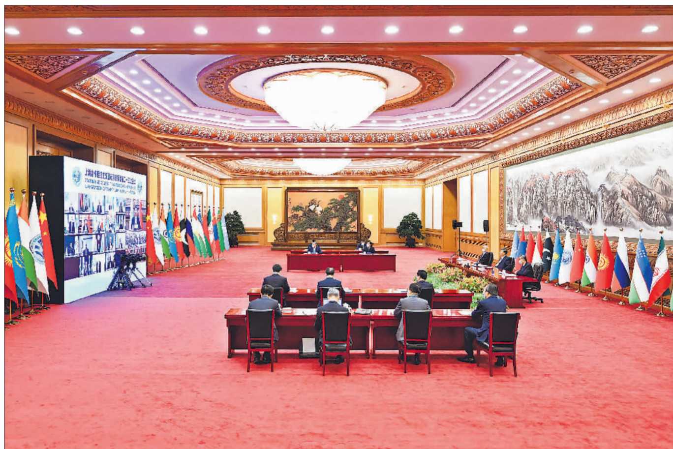
7月4日下午，国家主席习近平在北京以视频方式出席上海合作组织成员国元首理事会第二十三次会议并发表题为《牢记初心使命 坚持团结协作 实现更大发展》的重要讲话。