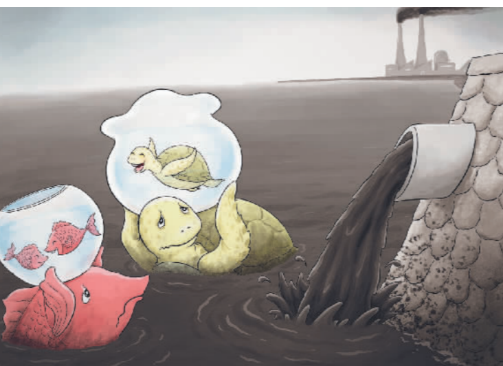
不能苦了孩子 黑龙江 郝延鹏