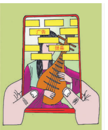
犹抱琵琶半遮面 吉林 何影

从法律和制度层面,我们必须疾呼,腐败分子必须终将受到惩罚;从文化层面,我们也要提醒那些被失眠折磨的涉事官员,贪腐是件愚蠢,蠢到家、蠢到内心深处的行为。