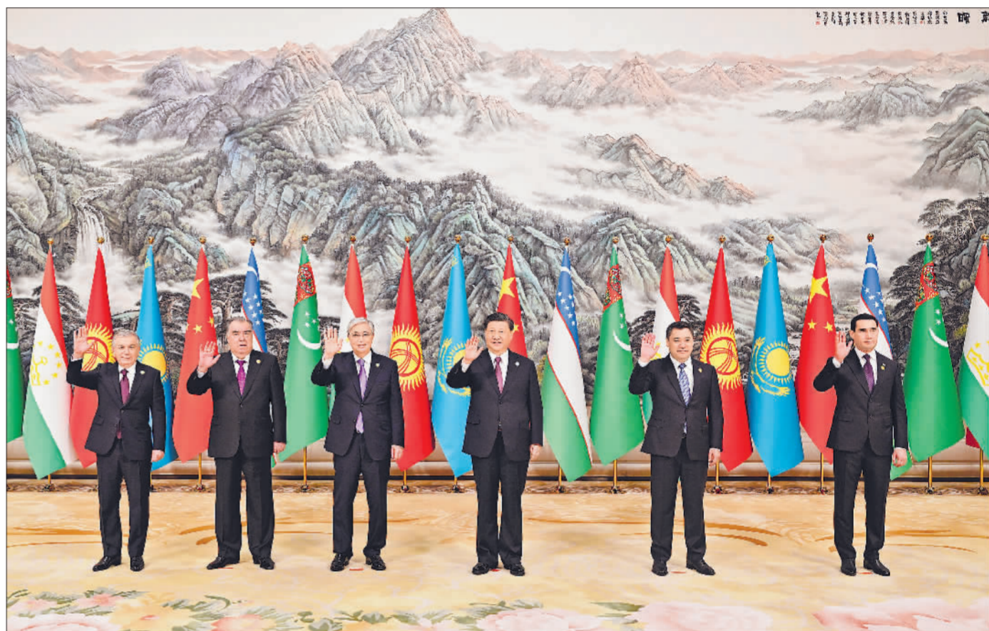
5月19日，国家主席习近平在陕西省西安市主持首届中国—中亚峰会并发表主旨讲话。哈萨克斯坦总统托卡耶夫、吉尔吉斯斯坦总统扎帕罗夫、塔吉克斯坦总统拉赫蒙、土库曼斯坦总统别尔德穆哈梅多夫、乌兹别克斯坦总统米尔济约耶夫出席。