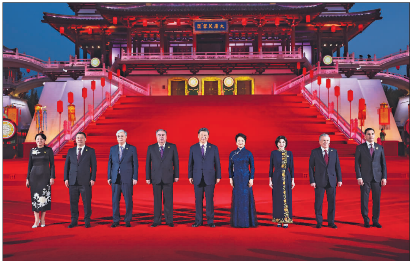
5月18日晚,国家主席习近平和夫人彭丽媛在陕西省西安市大唐芙蓉园为出席中国—中亚峰会的中亚国家元首夫妇举行欢迎仪式和欢迎宴会。宴会后,习近平夫妇同贵宾们共同观看中国同中亚国家人民文化艺术年暨中国—中亚青年艺术节开幕式演出。这是习近平夫妇在紫云楼前同贵宾合影留念。

新华社西安5月18日电(记者温蓉 蔡馨逸)5月18日晚,国家主席习近平和夫人彭丽媛在陕西省西安市大唐芙蓉园为出席中国—中亚峰会的中亚国家元首夫妇举行欢迎仪式和欢迎宴会。 维夏之月,百卉俱开。暮色中的大唐芙蓉园楼阁巍峨,流光溢彩,美轮美奂。 哈萨克斯坦总统托卡耶夫、吉尔吉