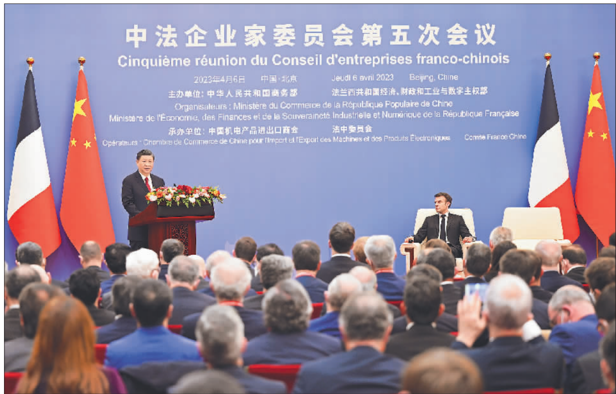
4月6日下午,国家主席习近平在北京同法国总统马克龙共同出席中法企业家委员会第五次会议闭幕式并致辞。