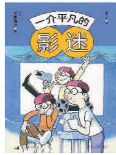
《一介平凡的影迷》 [日]手冢治虫著 雷丽媛译/谢晓校订后浪·北京联合出版公司

她们将以一种严肃、审慎的态度来回顾既往的成长历程;真正好的教育,应当是与孩子一同找到人生的支点,发现生活的美好与意义。