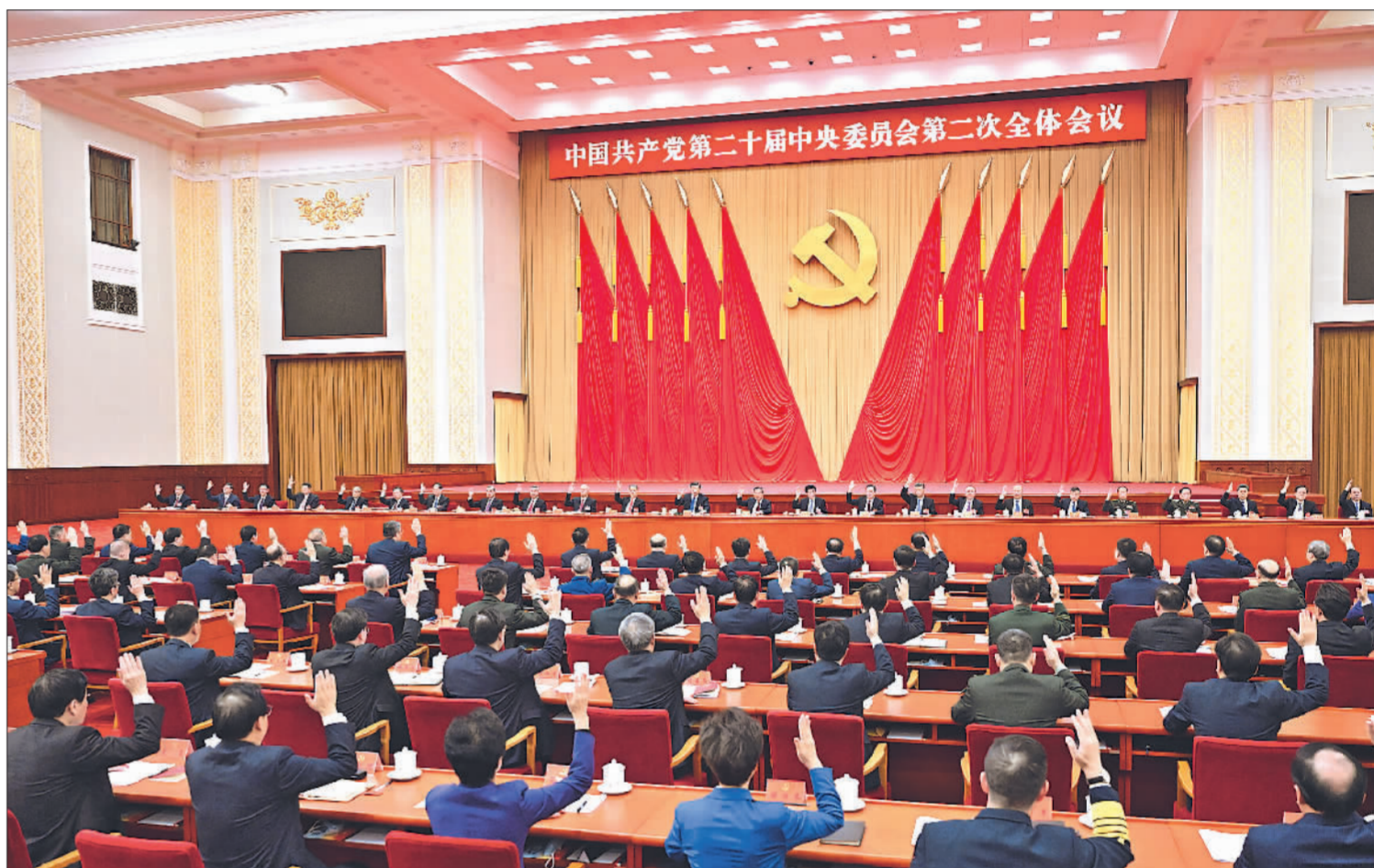
中国共产党第二十届中央委员会第二次全体会议,于2023年2月26日至28日在北京举行。中央政治局主持会议。