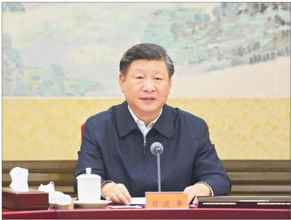
12月26日至27日，中共中央政治局召开民主生活会，中共中央总书记习近平主持会议并发表重要讲话。