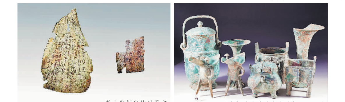
考古发掘出的甲骨文