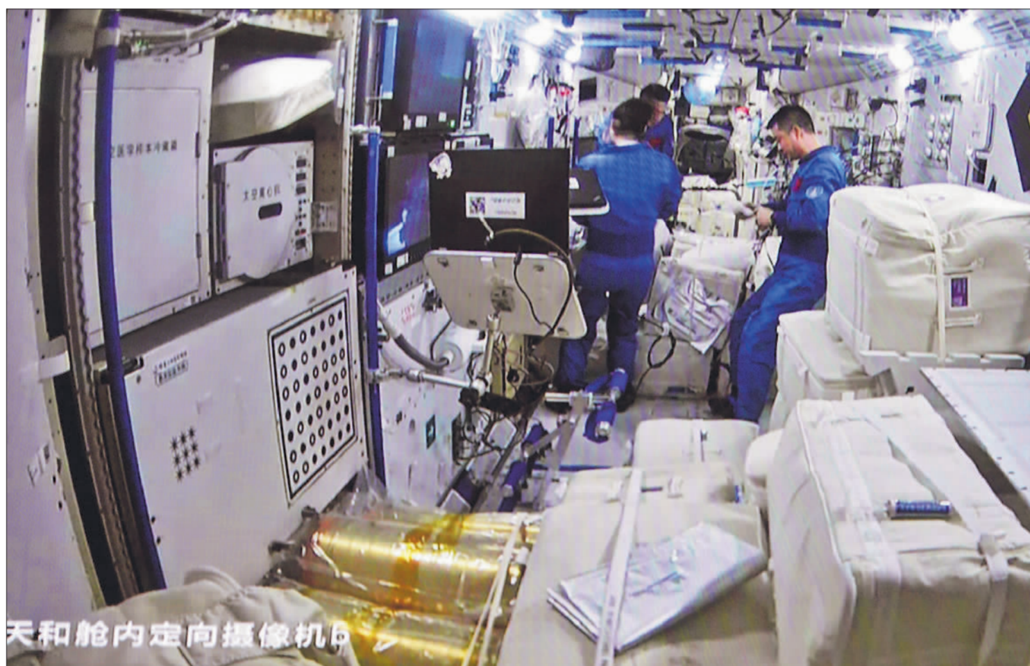
天和舱内定向摄像机