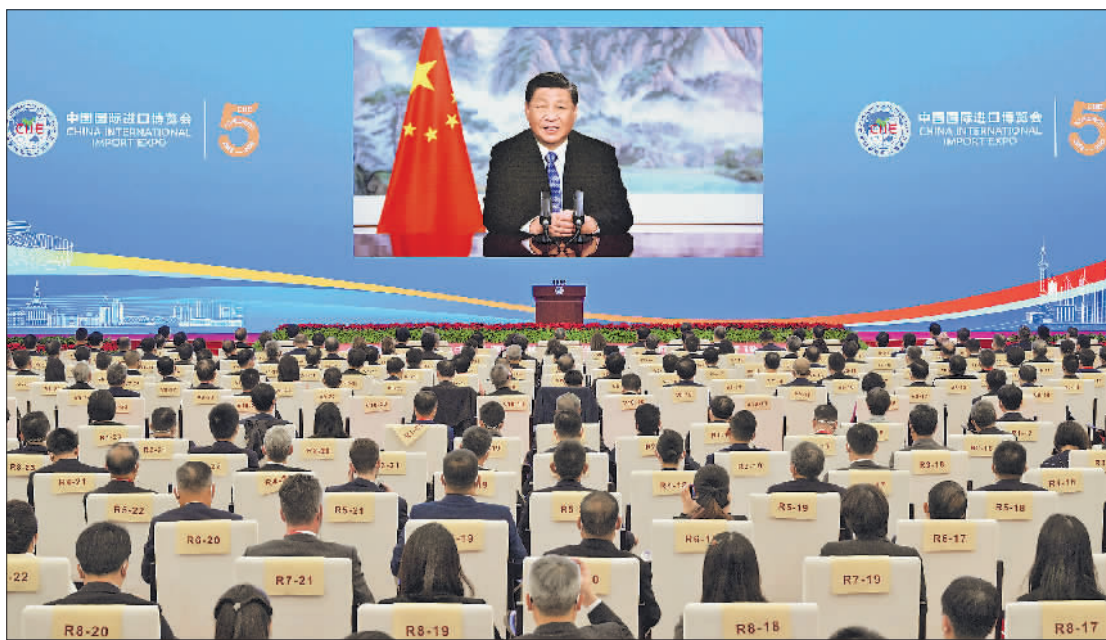
11月4日晚，国家主席习近平以视频方式出席第五届中国国际进口博览会开幕式并发表题为《共创开放繁荣的美好未来》的致辞。

新华社北京11月4日电 11月4日晚，国家主席习近平以视频方式出席在上海举行的第五届中国国际进口博览会开幕式并发表题为《共创开放繁荣的美好未来》的致辞。