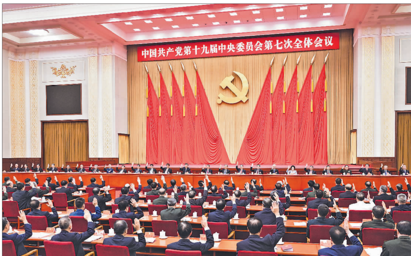
中国共产党第十九届中央委员会第七次全体会议,于2022年10月9日至12日在北京举行。中央政治局主持会议。