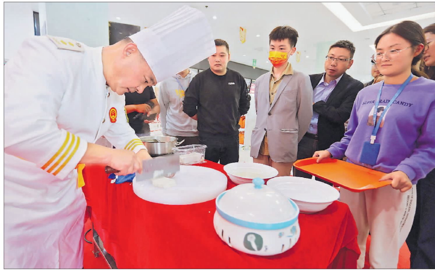
近日,江苏省扬州市总工会、市场监督管理局联合举办“名厨进名企,助力职工好食堂建设”活动,邀请中国淮扬菜大师杨军到扬杰电子有限公司职工食堂示范制作狮子头、文丝豆腐等菜品,并进行教学讲解。据了解,这一活动是为了提升职工食堂厨师的烹饪水平,为职工提供更好的餐饮服务。